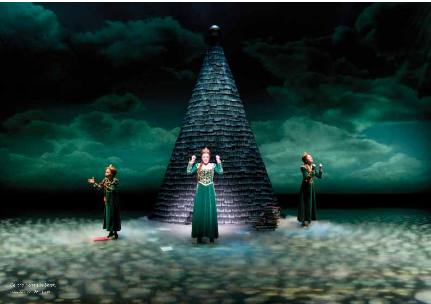
De drie Fiona's in Shrek .